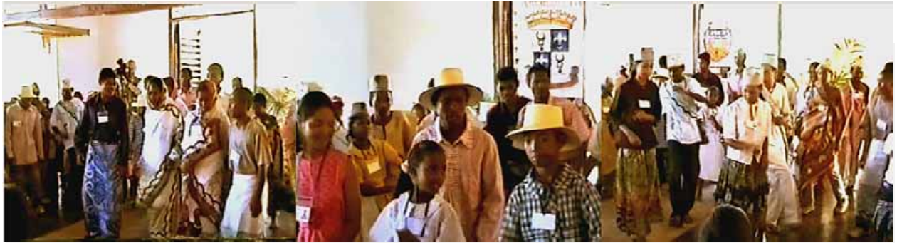
Die Schüler führten zur Begrüßung der Gäste Tänze der verschiedenen madagassischen Volksgruppen in den jeweils typischen Trachten vor.