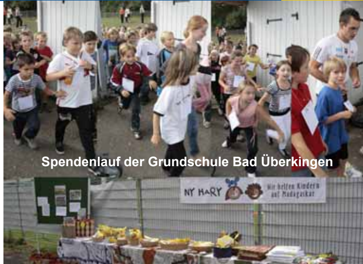
Spendenlauf der Grundschule Bad Überkingen