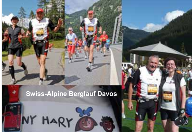
Swiss-Alpine Berglauf Davos