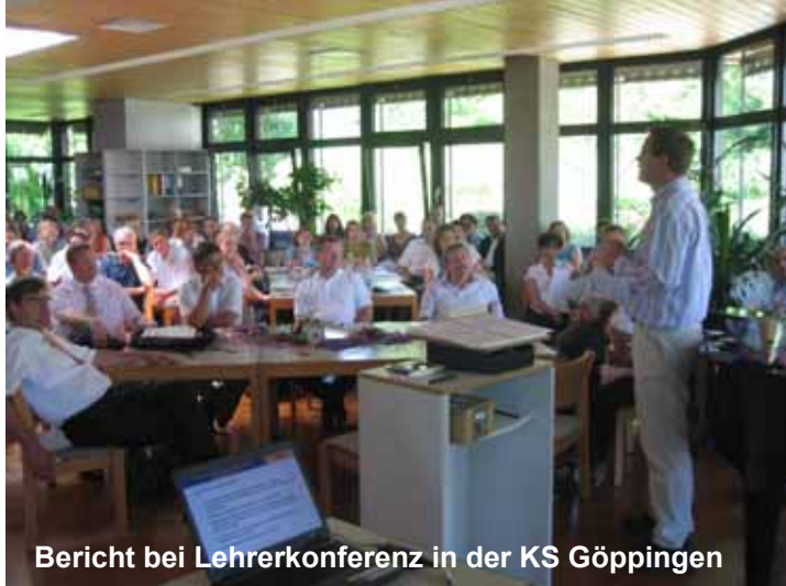
Bericht bei Lehrerkonferenz in der KS Göppingen