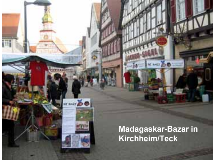
Madagaskar-Bazar in Kirchheim/Teck