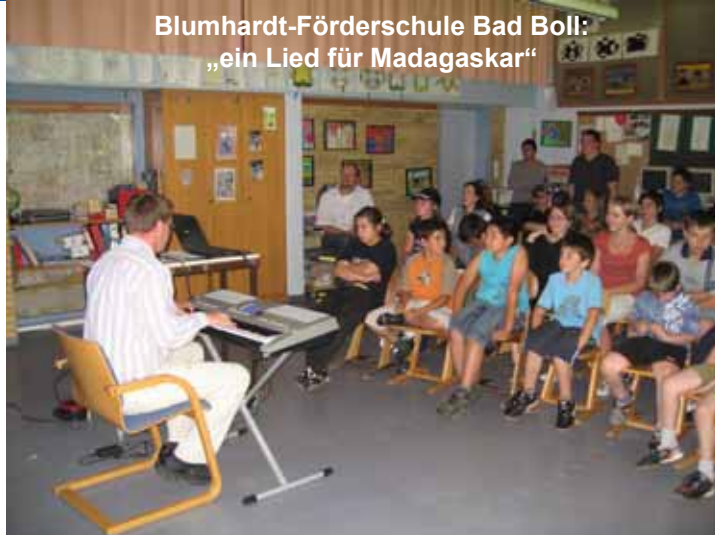
Blumhardt-Förderschule Bad Boll: „ein Lied für Madagaskar“