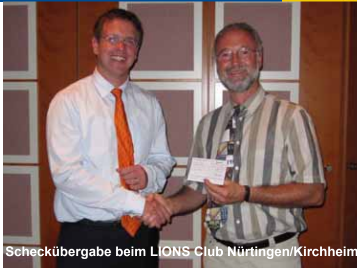
Scheckübergabe beim LIONS Club Nürtingen/Kirchheim